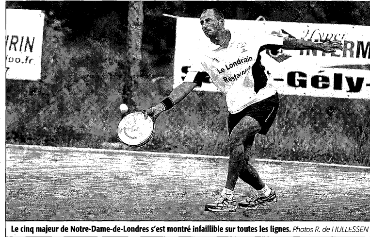
Le cinq majeur de Notre-Dame-de-Londres s'est montré infailible sur toutes les lignes.

Le jeu des familles avec aussi Hichame Rifai à la droite du fonds, a encore frappé face à une formation de Vendémian complètement dépassée. Trop souvent hors cadre, trop vite distancée. « Toute la semaine, on a très bien joué et notre parcours difficile nous a sans doute aidés à être concentrés », explique Patrice Charles. Déjà, contre Cazouls, on était mené 4-1 avant qu'on ne change notre façon de jouer. On renvoyait des balles trop tendues, trop courtes » pour le plus grand bonheur des cordiers. « On a