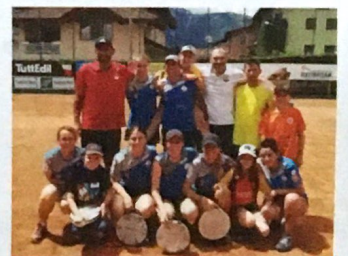
L'ÉQUIPE FÉMININE DU TAMBOURIN CLUB LONDONIEN CHAMPIONNE D'EUROPE 2018.

Ainsi, le Tambourin Club Londonien a sollicité une aide pour que son équipe féminine, championne de France, puisse participer à la coupe d'Europe, en Italie, les 7 et 8 juillet derniers. Elle en est revenue championne d'Europe, pour la troisième fois de son histoire !