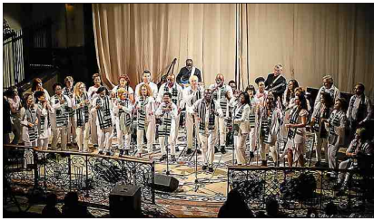
■ Le Kumbaya Gospel Choir en pleine représentation.

Ce samedi 6 mai, à 20 h 30, l'église Saint-Pierre sera le cadre d'un concert de gospel donné par la chorale Kumbaya Gospel Choir. Le public est attendu en nombre pour chanter et danser au son du gospel, des rythmes africains et partager un message de tolérance et