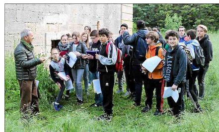
■ Une visite passionnante et enrichissante pour tous.

Il a retracé l'histoire de l'eau à Montpellier qui a commencé avec les puits et les citernes. Mais ces ressources sont devenues insuffisantes. Henri Pitot, membre de l'Académie des sciences de Paris, réalise alors au XVIII e siècle un