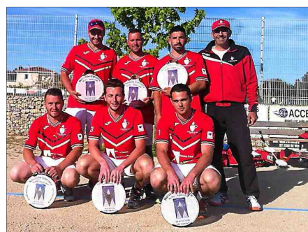
■ L'équipe N2 après sa victoire à Saint-Georges-d'Orques.

En revanche, les rouge et blanc n'ont toujours pas gagné chez eux. Ils sont tombés pour la troisième fois de la saison à domicile. Cette fois-ci en recevant Florensac, sur le score de 13 à 6. Après