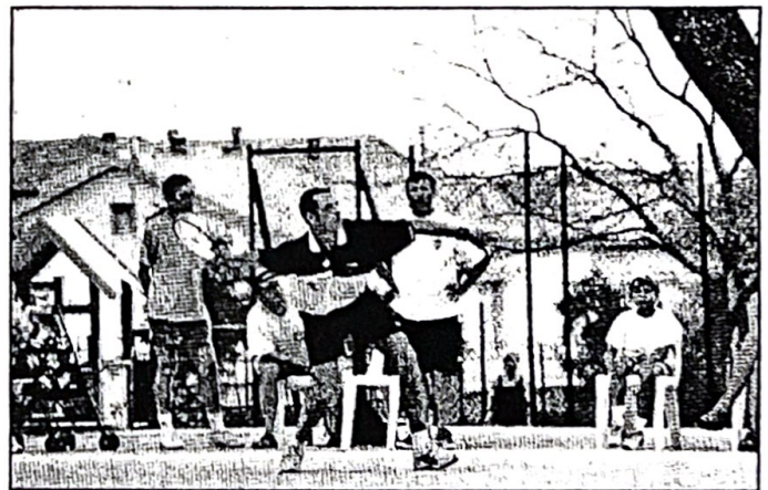
Le jeu de balle au tambourin suit une croissance régulière du nombre de ses licenciés.

Filles : samedi à Marignane (à partir de 9h30 au complexe Eurocopter) et dimanche aux Pennes (14h30 pour la finale).