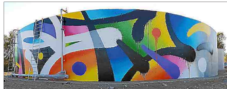
■ L'artiste Mist a élaboré cette fresque de 30 mètres sur 4.

La nouvelle station d'épuration de Saint-Martin-de-Londres est en passe d'être opérationnelle. Cet ouvrage conséquent avait l'inconvénient d'être visible de la route très passante qu'est la D986 (axe Ganges/Montpellier). La municipalité a donc décidé de réaliser une fresque monumentale sur le réservoir le plus en vue. Trente mètres de long sur quatre mètres de hauteur : il aura