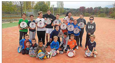
■ Les pensionnaires de l'école sont répartis en deux groupes.

Alors que la saison estivale s'est terminée en apothéose voici quelques semaines, avec la soirée du tambourin qui a vu plusieurs équipes du club être récompensées, les éducateurs du club sont déjà sur le pont pour la reprise des entraînements des différentes équipes de l'école de tambourin. Depuis le début du mois de septembre, les jeunes pensionnaires de l'école sont répartis en deux groupes distincts : les poussins et les débutants, tous âgés de