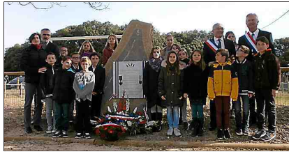
■ Les enfants et les élus présents pour cette cérémonie.