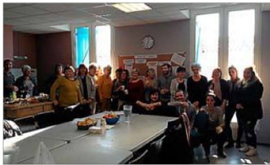
■ Personnels et bénévoles de l'Agantic.