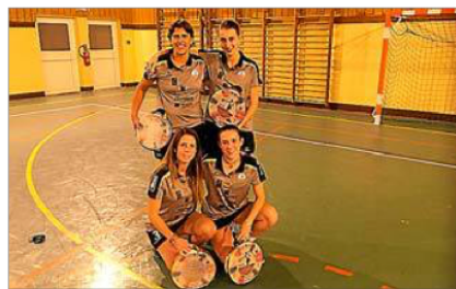
■ Les Londraines affronteront les Paulhanaises.

Après avoir successivement battu Poussan en quart de finale, puis Méze en demi-finale, les Londraines vont disputer la finale de la coupe de l'Hérault de tambourin en salle, ce samedi 19 janvier à 15 h 30, dans le gymnase de Paulhan. Elles y affronteront l'équipe locale Paulhanaise, championne de France en titre et qui vient d'être fraîchement sacrée championne de l'Hérault pour la première fois de son histoire. Cette finale verra s'affronter les deux derniers vainqueurs de