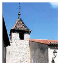
■ Une revue incontournable sur la ville de Ganges.

Ferdy Bezzina va dans le sens de cette recherche par son évocation Des vestiges de l'époque romaine au secteur des Baucels , qu'un rapport de fouilles d'Édouard Maistre (prêtre au canton de