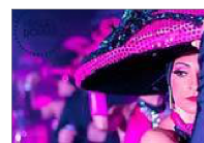
■ Folies douces en scène.

théâtrale donnée par les enfants de l'association Taca. En deuxième partie spectacle intitulé Ces années-là de la compagnie Folies Douces, des strass, des plumes des paillettes et de la grâce. Rendez-vous donc à 11 h 30 à la salle polyvalente pour savourer l'apéritif et les agapes au cours de ce fabuleux spectacle.