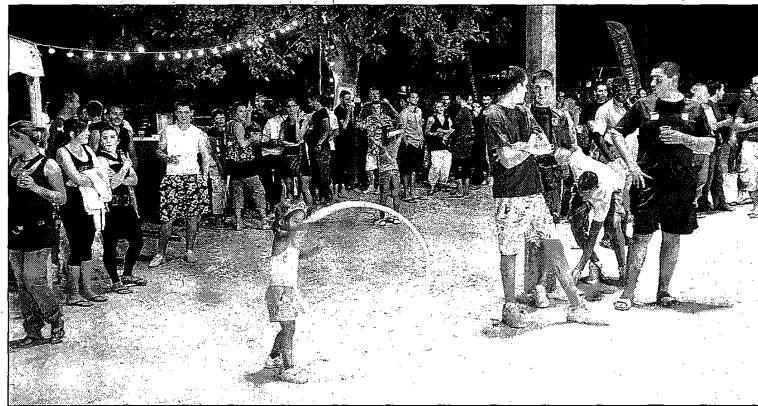
Occitania contre Nord Italia, la 22 e édition du Tambourin d'or a fait le spectacle !

Nicolas Estimbre ne dira pas le contraire. Le président du club hôte, Cournonterral, avait bien fait de prévoir une deuxième tribune, pleine. Le Tambourin d'or est comme une réunion de "famille" que les anciens, notamment,