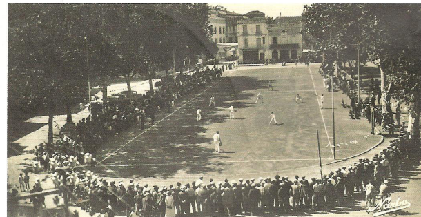
Match à Pezenas dans les années 50

Avec nos remerciements à Patrice Charles ■