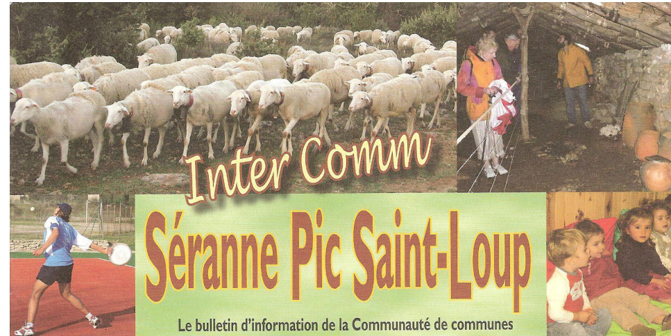
Saint-Martin-de-Londres - Causse-de-la-Selle - Notre-Dame-de-Londres - Viols-le-Fort - Saint-Jean-de-Buèges - Saint-André-de-Buèges - Viols-en-Laval - Mas-de-Londres - Pégaïrolles-de-Buèges - Rouet