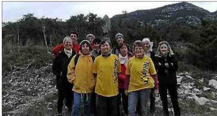
■ Le groupe de marcheurs lors d'une précédente édition du Téléthon.

Samedi 5 décembre, dans le cadre de l'édition 2015 du Téléthon, l'association Les Randonneurs gangeois propose un petit parcours vers Laroque.