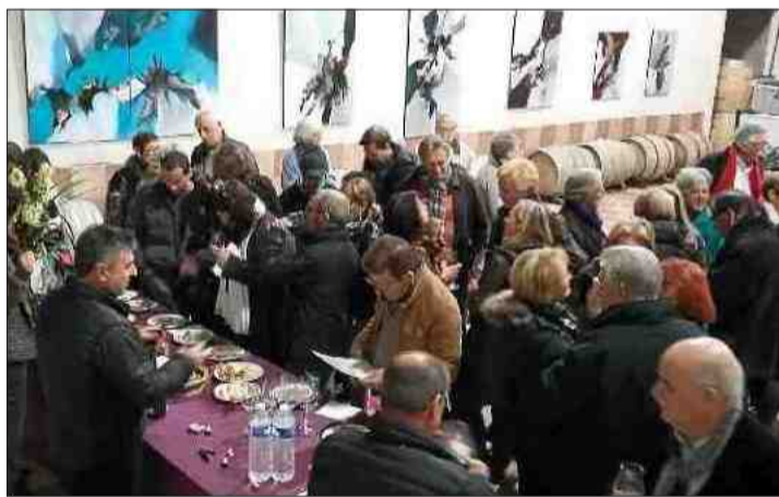
■ Au Clos des Augustins, une dégustation très appréciée.