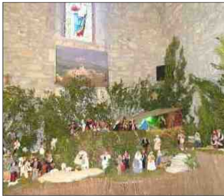
■ Un petit village d'antan dans l'église.

Dès 10h, samedi 5 et dimanche 6 décembre, les amoureux de tradition provençale ne manqueront pas de venir admirer cette merveilleuse exposition de santons et crèches, proposée depuis vingt-neuf ans maintenant. Choisir, parmi la multitude de santons présentés, celles et ceux qui viendront rejoindre les petits personnages de votre crèche, ne sera pas chose facile. Qui du vigneron, de la porteuse d'eau ou de la gitane, viendra compléter votre collection. Mémoire de tout un passé chargé de tradition, ils contribuent à la magie de Noël. Ils sont l'âme de nos crèches. Pour vous en convaincre, il vous suffira d'admirer la merveilleuse crèche réalisée dans l'église, par les habitants du village :