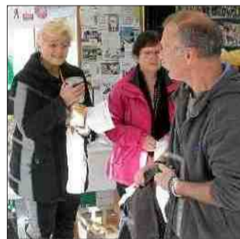
■ Deux jours durant, les Teyrannais ont répondu présents.

Corres. ML : 06 58 81 40 02 + midilibre.fr