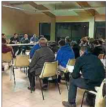
■ Une quarantaine de membres du club à l'assemblée générale.

Le bilan financier présenté par le trésorier a mis en évidence