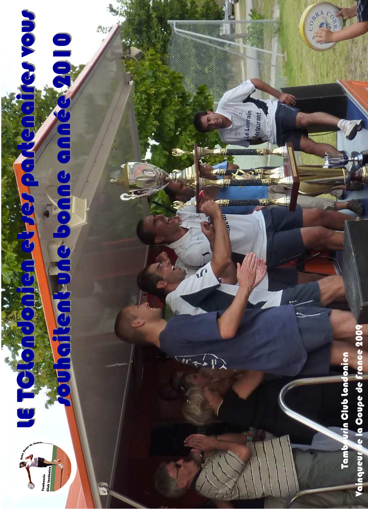
Tambourin Club Londonien Vainqueur de la Coupe de France 2009