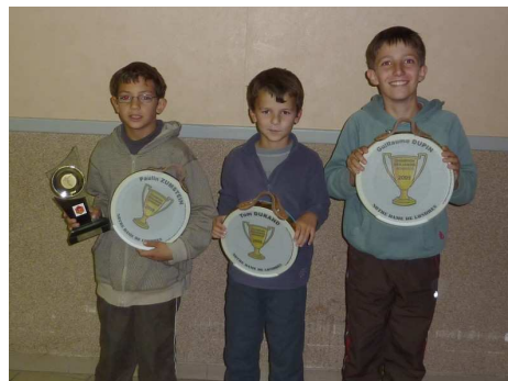
Les benjamins ont reçu des tambourins personnalisés