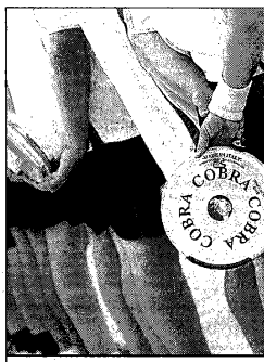
Les champions.

Les championnats feront relâche ce week-end de retour sur les terrains en juillet.