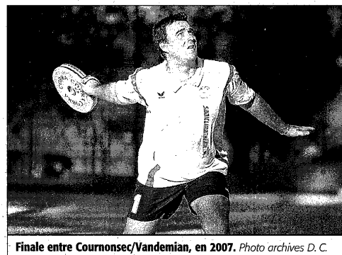
Finale entre Courmonsec/Vandémian, en 2007.