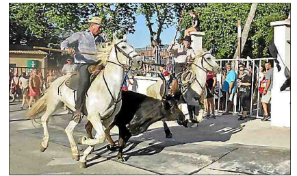
■ Première bandido, avec la manade Vellas.

Samedi après-midi, les jeunes ont fait un festival pendant la première bandido ! Plusieurs biéous ont été attrapés. Voilà qui augure bien pour la suite. Le défilé des bandes a été grandiose, jusqu'à l'arrivée au pied du château. Après un discours passionné sur les traditions taurines locales, l'orchestre Mercury a joué La Coupo Santo , suivie par La Marseillaise . Ces deux chants ont été entonnés par toute l'assistance, faisant vibrer les frondaïsons du parc. L'encierro, sur le parking de la mairie, en soirée, a permis aux jeunes de montrer qu'ils n'avaient rien perdu de leur ardeur, ils ont fait