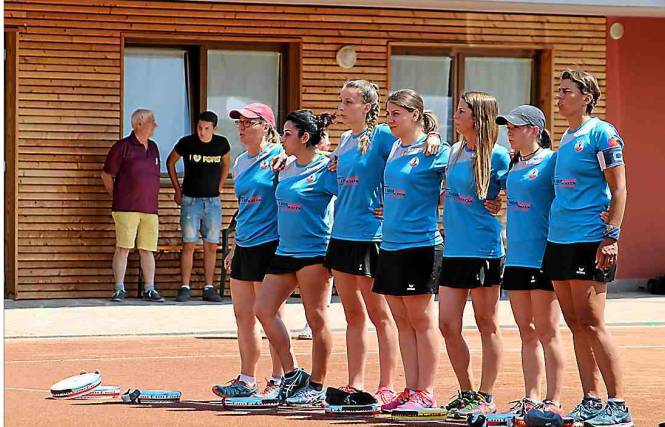
■ L'équipe féminine va tenter de remporter un nouveau trophée.

Alors que l'actualité des clubs est au ralenti en ce début du mois d'août, les Londrains étaient opposés à Viols-le-Fort en 1/8 e de finale de la coupe de France masculine. Une rencontre qu'ils démarraient dans la peau de favoris mais qui représentait un grand danger face à des Violsiens n'ayant rien à perdre. Effectivement, auteurs d'une partie médiocre, les bleus ont eu toutes les peines du monde à s'imposer sur un score flatteur de 13 jeux à 11 alors qu'ils ont été menés toute la partie. Il leur faudra élever grandement leur niveau de jeu dès le week-end prochain s'ils veulent aller plus loin dans cette compétition.