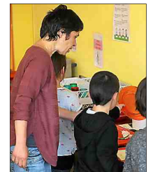
■ Sensibiliser les enfants.

L'association Pic'Assiette a clôturé son programme d'actions de sensibilisation et de lutte contre le gaspillage alimentaire à l'école Agnès-Gelly. Durant cette première phase, les enfants, avec l'aide d'une animatrice, ont trié et pesé chaque jour le reste de leurs assiettes. Cette expertise portait sur trois jours, soit 756 repas et a indiqué que la moyenne jetée par jour et par élève était de 105, 82 grammes. C'est inférieur à la moyenne nationale (120 grammes), mais l'objectif est d'en faire encore mieux. Avant de partir en congés d'été les élèves ont émis quelques idées : « Faire des assiettes de différentes tailles pour que l'on puisse goûter. Nous demander avant de nous servir si l'on veut une grosse ou petite part. Faire des recettes avec le pain non consommé. Mettre moins de sauce ou la mettre de côté. ». Au cours d'une deuxième phase les enfants ont participé à des activités ludiques de sensibilisation pendant le temps méridien (jeux, ateliers...).