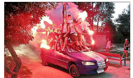
■ La voiture des bandes, pour le défilé d'ouverture.

► Correspondant Midi Libre : 06 81 12 75 05