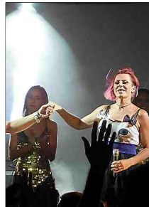
■ L'Orchestre Krystal Noir.

► Correspondant Midi Libre : 06 10 22 82 17