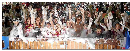
■ L'apéro mousse, toujours un moment convivial.