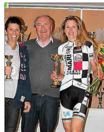
Le Montagnac AC brille aussi au féminin sur toutes les courses.

peurs-pompiers et agents territoriaux, disputé à Chinon (Indre-et-Loire). À ce jour, le club totalise 82 podiums, dont, au scratch, 10 premières places, 6 deuxièmes et 6 troisièmes et, par catégories, 23 premières places, 15 deuxièmes et 22 troisièmes; avec notamment 14 podiums à l'Héraultaise, début avril, à Gignac.